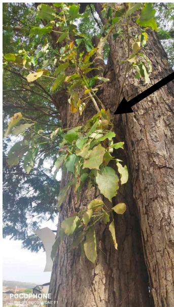
Figueira mata pau